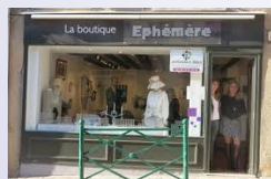
Les magasins éphémères

Les Français consomment autrement depuis la crise de 2008. On nous parle de consommation responsable. De nouveaux termes apparaissent parmi lesquels le financement participatif, l'habitat participatif ou encore les magasins éphémères . Même les soldes d'hiver ne sont pas épargnées. En effet, les français sont de plus en plus séduits par une nouvelle pratique émergente : le «Click and Collect», particularité permettant la réservation d'un produit se trouvant en stock dans le magasin et pratiquée par de très nombreuses enseignes.